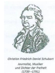
Christian Friedrich Daniel Schubart Journalist, Musiker und Dichter der Freiheit (1739 – 1791)